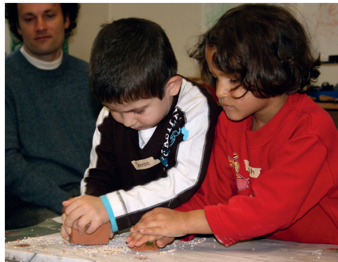
Arbeit in einer Kindertagesstätte

Für den zusätzlichen Erwerb der Fachhochschulreife kann Unterricht in Fachenglisch auf Niveaustufe B2 und Mathematik belegt werden.