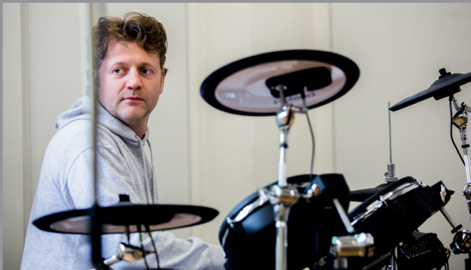
Probe im Musikraum