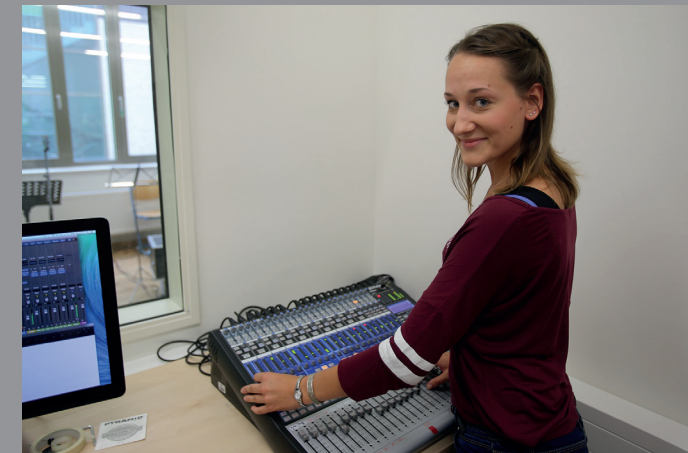
Arbeit im Tonstudio