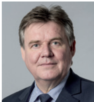
Rainer Schulz, Staatsrat der Behörde für Schule und Berufsbildung (BSB)