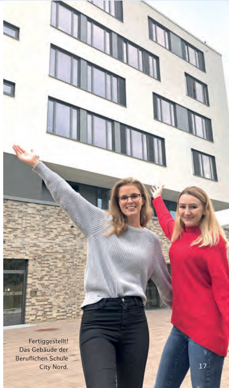
Fertiggestellt! Das Gebäude der Beruflichen Schule City Nord.

Die Berufliche Schule City Nord (BS 28) hat 2018 einen großen Neubau erhalten. 2019 wurde zudem das achtgeschossige Hochhaus instand gesetzt und umgebaut. Jetzt gibt es Kompartments mit neuen Fenstern, einem neuen IT-Netz und interaktiven Panels. Mit dem neuen hochleistungsfähigen WLAN können sich die Schülerinnen und Schüler auch mit ihren eigenen digitalen Endgeräten wie Smartphones, Tablets und Notebooks aktiv einbringen, digitale Lerninhalte an den interaktiven Panels übernehmen oder auch eigene Inhalte auf die Panels schicken. Kosten: rund 2,5 Mio. Euro.