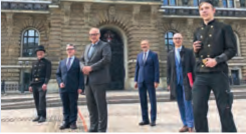
Landespressekonferenz „Ausbildung und Corona“ im Juni 2020 im Hamburger Rathaus

konnten dadurch besser erreicht werden. Ab dem 25. Mai stellten die berufsbildenden Schulen sicher, dass die Schülerinnen und Schüler in allen Bildungsgängen Präsenzangebote in Kombination mit Fernunterricht erhielten. Zusätzlich wurden in den Schulgebäuden die Kammerprüfungen in der dualen Ausbildung nach BBiG/HwO durchgeführt.