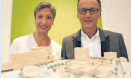
Die Schulleitung der Beruflichen Schule Holz, Farbe, Textil zeigt das Modell des geplanten Neubaus in Barmbek.

Rund 100 Mio. Euro pro Jahr verwendet der Hamburger Senat für Sanierungs- und Bauprojekte an den staatlichen berufsbildenden Schulen. Die Höhe dieser jährlichen Investitionen hat sich im Vergleich zu vor zehn Jahren mehr als verzehnfacht. 19 der 31 berufsbildenden Schulen sind inzwischen saniert oder neu gebaut, neun weitere folgen in den kommenden Jahren.